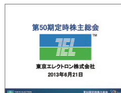
株主総会関連資料

アナリスト・機関投資家向けに決算説明会を四半期ごとに開催しており、マスメディアにも公開しています。また、説明会で使用した資料をすべてWebサイトに掲載することで、一般の個人投資家の皆さまにも情報を提供しています。