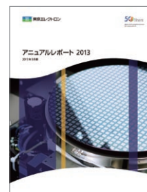
アニュアルレポート