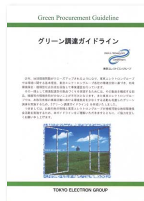
グリーン調達ガイドライン