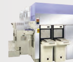
プラズマエッチング装置 Tactras™