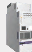
熱処理成膜装置 TELINDY PLUS™