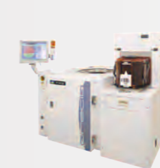
ウェーハプローバ Precio™