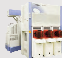
枚葉成膜装置 Triase s ™