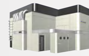
有機ELパネル製造用 インクジェット描画装置 Elius™ 2500