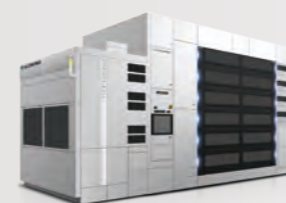
コータ/デベロッパ CLEAN TRACK™ LITHIUS Pro™ Z