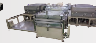
FPDプラズマエッチング/アッシング装置 Impressio™