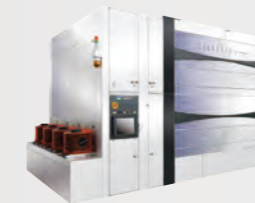
枚葉洗浄装置 CELLESTA™ -i