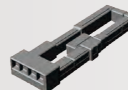
FPDコータ/デベロッパ Exceliner™